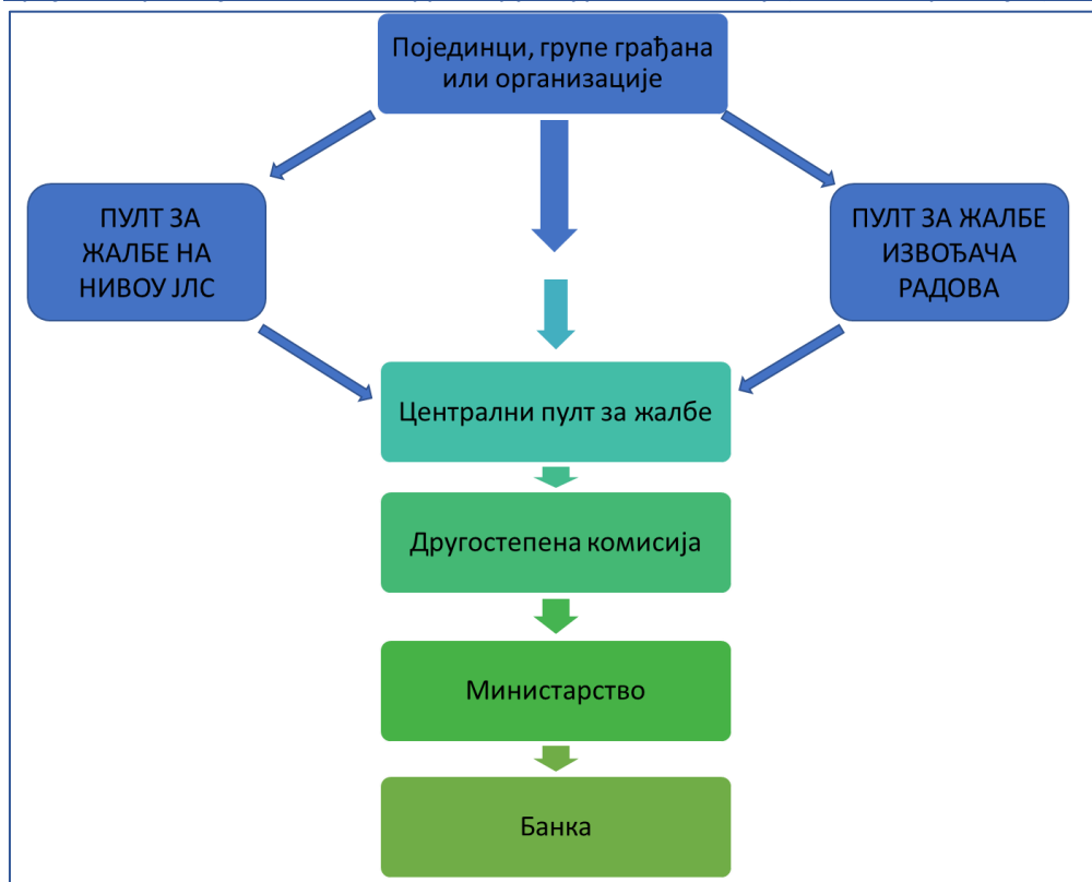
Слика 1. Шема функционисања жалбеног механизма